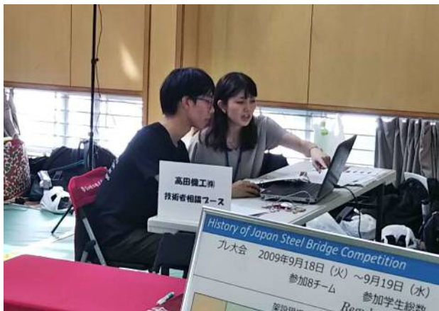
鋼橋3Dモデル作成体験の様子