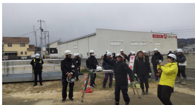
オフィシャルパートナーとコラボした見学会