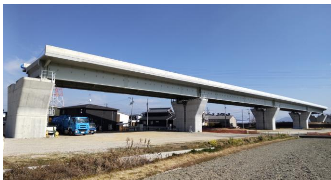
高橋第二高架橋全景

②おまけ→ https://www.youtube.com/watch?v=VV0hiBT_pTE