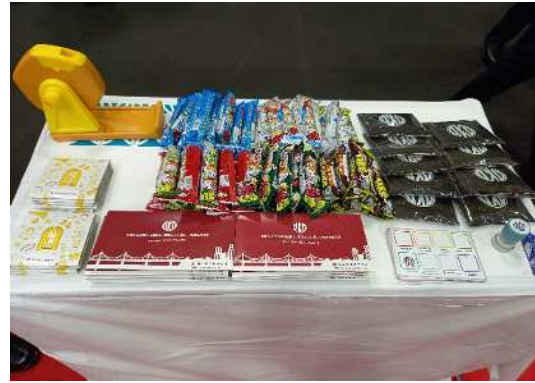
写真 弊社ブースとスタンプラリー景品